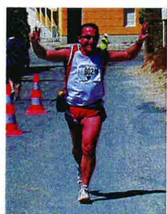
La joie de l'arrivée...