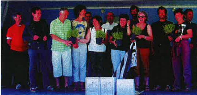
Ils sont venus de l'autre côté de la France pour mettre le feu à la course... mission réussie pour nos amis bretons !